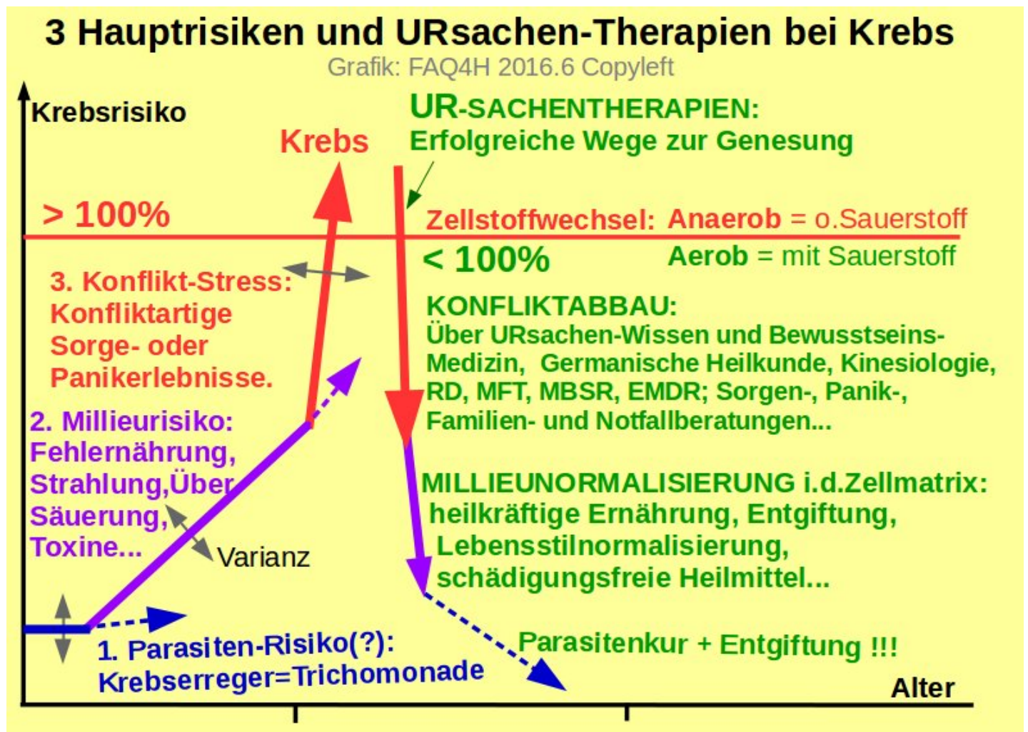
Abb. 3: die 3 Hauptrisiken bei Krebs und die zugehörigen erfolgreichen Gegenmaßnahmen

Das Erkennen, Abstellen und Therapieren der wirklichen Quell-URSACHEN ist neben einer schädigungsfreien, möglichst natürlichen und biologisch verträglichen Therapie bei Genesungserfolgen fast immer beteiligt. Die nachfolgende Abbildung zeigt dieses Normalisierungs-Schema, das besonders auch austerapierte Patienten zu retten vermag.