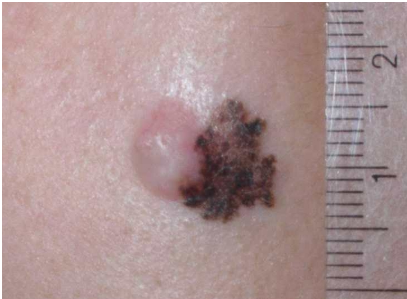
Abbildung 1: Melanom an einer Wange, Quelle: de.wikipedia.org/wiki/Malignes_Melanom

HINWEIS: Dieser Beitrag, wie alle anderen Seiten dieser Homepage auch, ist in keinem Falle eine Handlungsempfehlung bei einer Erkrankung oder ein Ersatz für eine medizinische Beurteilung oder Behandlung durch einen Arzt oder Therapeuten. Dies ist lediglich eine private Informationssammlung über den derzeit bekannt gewordenen Stand von Heilungswissen. Mehr siehe auch unter Hinweise .